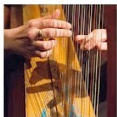
Open Mic POTRVÁ #61 6. 2. 2013 fotografie: 57