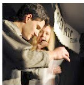
Open Mic POTRVÁ #62 6. 3. 2013 fotografie: 60