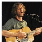
Open Mic POTRVÁ #60 2. 1. 2013 fotografie: 49