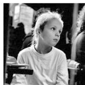
Open Mic POTRVÁ #59 5. 12. 2012 fotografie: 49